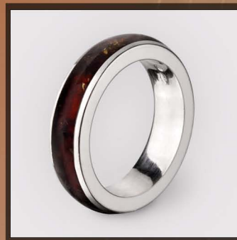
R-200 4,5g - 5,8g