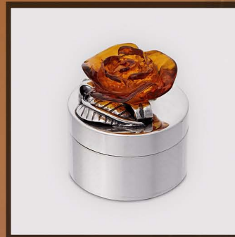
U-252 18,7g - 20,0g